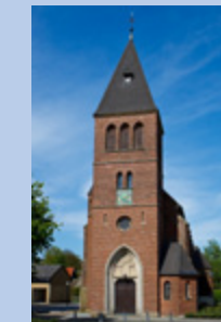
Kirche „Zu den Heiligen Schutzengeln“