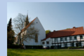
Stiftskirche und Stiftshaus mit Zisterzienser- und Stiftsmuseum