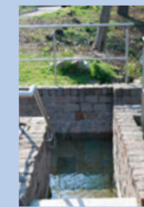
Bewegungspark mit Kneippanlage