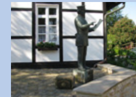
Afrouper vor der Tourist-Information